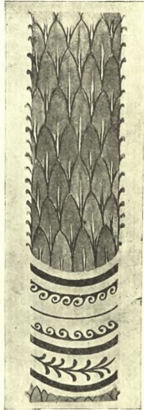
Εἰκ. 6. Τὸ φοινικοειδὲς πλέγμα.