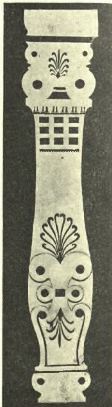
Εἰκ. 3. Ποῖς τῆς κλίνης.