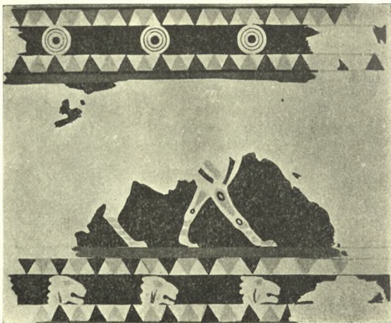
Εἰκ. 7. Ζώνη λεόντων ἐν βαδίσματι καὶ κεφαλῶν λεόντων.

λαὸν ὁ Ἀρχέλαος ἔκρινε τόσον ἄξιον προσοχῆς καὶ τιμῆς ὥστε διὰ τῆς δημιουργίας τοῦ τακτικοῦ πεζοῦ στρατοῦ τῆς χώρας νὰ θέσῃ τούς, χωρικούς τὸ πλείστον βεβαίως, ὀπλίτας ἄνδρας παραλλήλως πρὸς τοὺς ἀπὸ αἰῶνων εὐγενεῖς τῆς χώρας ἱππότες ἑταίρους , ὀνομάσας αὐτοὺς πεξεταίρους . Οἱ πλείστοι ἐκ τούτων ἐγένοντο τοιουτοτρόπως καὶ μέτοχοι ἀνωτέρου πολιτιστικοῦ βίου. Ἀλλὰ τὰ ἀριστοκρατικά γένη τῆς χώρας τὰ συγκροτοῦντα τὸ μόνον σημαντικὸν ἕως τότε ἱππικὸν σῶμα τοῦ στρατοῦ αὐτῆς καὶ περιστοιχίζοντα τὸν βασιλέα καὶ κατὰ