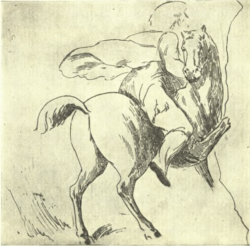
Εἰκ. 4. Ὁ πρῶτος ἐξ ἀριστερῶν ἱππέως.

φαινομενικῶς, τὸν ἄλλον βραχύτερον κυανόχρουν. Ὁραῖα δηλοῦνται ἐπὶ τοῦ μαρμαρίνου πίνακος πάντα ταῦτα. Ἄλλ' ἀριστοτεχνικῶς εἰργασμένοι εἶναι οἱ ἵπποι, εὖρωστα, εὐγενῆ ζῷα. Ὁ πρῶτος ἀναχαιτίζεται βιαίως ὑπὸ τοῦ ἱππέως, ὀρθουμένου στερεῶς ἐπὶ τῆς ῥάχεώς του καὶ σφίγγοντος ἀσφαλῶς τὰ σκέλη πρὸς τὰ ὀπίσω εἰς τὴν κοιλίαν, ἀναγκασζόμενος πρὸς τοῦτο ἕνεκα τοῦ ἀδή-