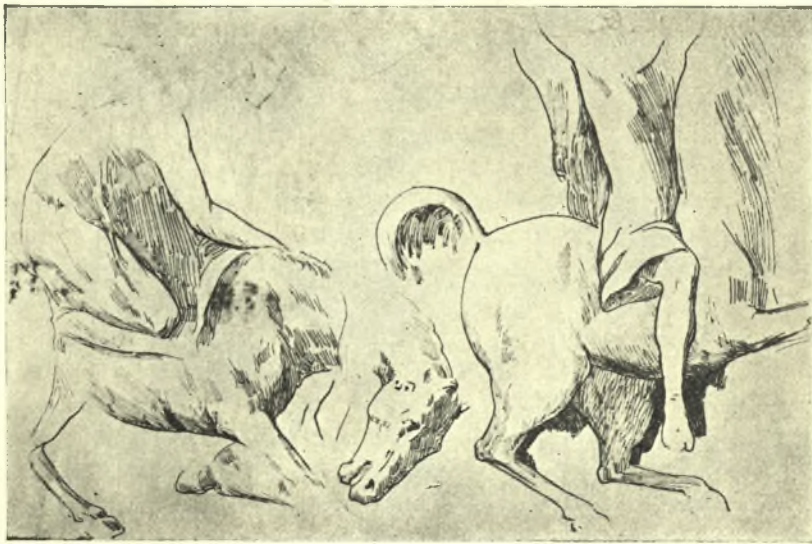
Εἰκ. 5. Ὁ εἰς γόνατα πίπτων ἵππεὺς καὶ ὁ προτρέχων αὐτοῦ.

δεικνύει καὶ ἡ τοῦ ἡμετέρου τάφου εἰκὼν. Ἐξαιρέτως ἐπιτυχῆς παρουσιάζεται εἰς τὸ βλέμμα μας καὶ ὁ δεύτερος σωζόμενος ἵππεὺς διὰ τοῦ ἐν τῷ σφοδρῷ καιπασμῷ καταπεσόντος εἰς γόνατα ἵππου, τοῦ ὁποίου ἡ κεφαλὴ ἐκφράζει ὅλον τὸ ἄλγος τοῦ δυστυχίσαντος εὐγενοῦς ζώου. Καὶ ὁ τρίτος ὡσαύτως διὰ τῆς θριαμβευτικῆς στάσεως τοῦ ἰδικοῦ του ἵππου, ὡς δεικνύει ὅλη του ἡ κίνησις, ἀλλὰ πρὸ πάντων ἡ καμπυλοειδὴς ἀνύψωσις τῆς οὐρᾶς ὁμοίως παρουσιαζομένη εἰς τοὺς θριαμβεύοντας Κενταύρους τῆς ζωοφόρου τοῦ Παρθενῶνος — διὰ νὰ ἀναφέρω ἓνα μέγα παράδειγμα — ἐνῶ οἱ νικημένοι ἐν αὐτῇ καταβιβάζουν καὶ κρύπτουν σχεδὸν τὸ χαρακτηριστικὸν τοῦτο ἄκρον τοῦ σώματός των.