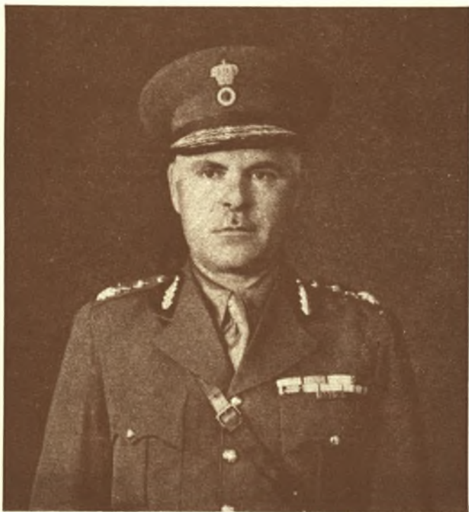
ΚΩΝΣΤΑΝΤΙΝΟΣ Α. ΤΟΤΣΙΟΣ

Έγεννήθη έν Τυρνάβω τῷ 1894. Μετά τās έγκυκλίους του σπουδās εισηχθη εἰς τήν Σχολήν Εὐελπίδων καί ἐξήλθεν άνθυπολοχαγός του Πυροβολικού, ἔλαθε μέρος εἰς πλείστας τῶν μαχῶν έν Μακεδονία καί έν Μ. Ἀσία τραυματισθείς έν Ἀϊδινίῳ. Ἐπαρashedμοφορήθη κατ' ἐπανάληψιν. Διῶκησε διαφόρους μονάδας Πυρ/κού καί ὡς ἐπιτελ. αξιωματικός ἐξέδωκε πραγματείαν περί συνδέσμου Πυρ/κού καί Πεζικού. Προήχθη Ὑποστράτηγος τῷ 1938.