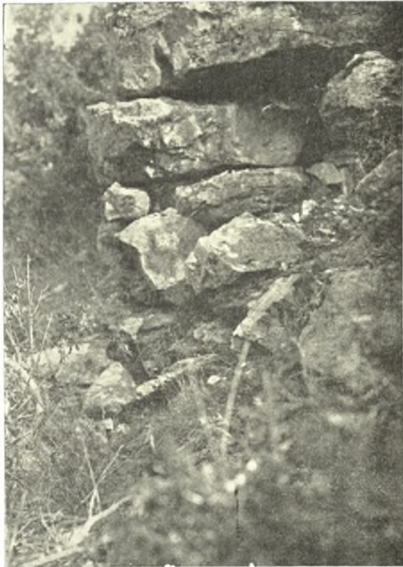
Εἰκ. 3. Τμήμα τείχους ἐκ τῆς δυτ. πλευρᾶς τῆς ἀκροπόλεως τῶν Λειβηθρων.

γωνται εἰς τὴν αὐτὴν ἐκείνοις ἐποχὴν ἦτοι τὴν γεωμετρικὴν. Οἱ τάφοι οὗτοι προήρχοντο, κατὰ τὴν παράδοσιν ἐκ συνοικισμοῦ ἀρχαιοτάτου, καταστραφέντος ὑπὸ χολέρας. Πρὸς πιθανὴν δὲ ἀνακάλυψιν τῶν ἐρειπίων τοῦ συνοικισμοῦ τούτου ἀναζητήσας τὰς σπανιζούσας περὶ τὸν ἀνα-