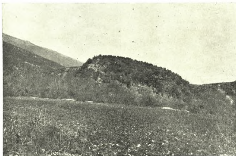
Εἰκ. 2. Ἀποψὶς τῶν χειμάρρων Καβουρόλακκα καὶ Γρίβα ἐκατέρωθεν τῆς ἀκροπόλεως.

δὲ περὶ τὸν Ὀλυμπον χειμάρρων καὶ ὁ Σῦς ἔστι) τότε οὖν οὗτος ὁ ποταμὸς κατέβαλε μὲν τὰ τεῖχη Λιβηθρίοις, θεῶν δὲ ἱερὰ καὶ οἴκους ἀνέτρεψεν ἀνθρώπων, ἀπέπνιξε δὲ τοὺς τε ἀνθρώπους καὶ τὰ ἐν τῇ πόλει ζῶα ὁμοίως τὰ πάντα. Ἀπολλυμένων δὲ ἤδη Λιβηθρίων, οὕτως οἱ ἐν Δίῳ Μακεδόνες, κατὰ γε τὸν λόγον τοῦ Λαρισαίου ξένου, εἰς τὴν ἑαυτῶν τὰ δοτᾶ κομίζουσι τοῦ Ὀρφέως». Ὁ Πausanias διὰ τῶν ὀλίγων τούτων στίχων ἱστορεῖ τὴν ἀκριβῆ θέσιν τῶν Λειβήθρων καὶ τὰς τύχας τούτων· ὅτι δηλ. ἡ πό-