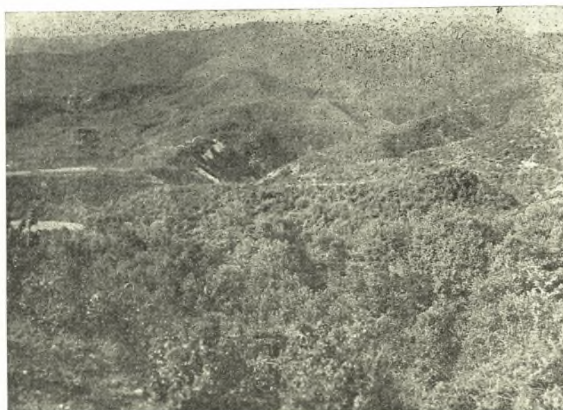
Εἰκ. 1. Γενικὴ ἀποψὶς τῶν Καναλίων.

Ὁ δὲ Ζυλιάνας φέρεται καὶ κατὰ θηλυκὸν γέ-