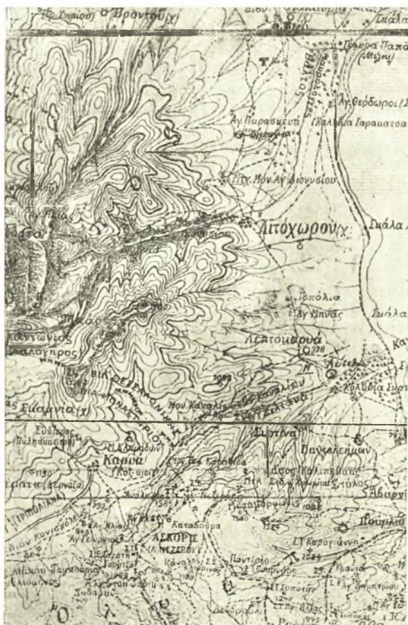
Εἰκ. 8. Τοπογραφικὸς χάρτης τοῦ ΝΑ Ὀλύμπου.

Πιμπληίδος ἄγχι, ἔξω τῆς πόλεως καὶ ἐπὶ τῆς ἐπὶ τὸ ὄρος Ὀλυμπον, μέχρι τοῦ ὁποίου ἠδύνατο νὰ ἐκτείνηται τὸ τέμενος, ἄβατον ταῖς γυναιξὶ λόγῳ τῆς θέσεως, οὐχὶ μακρὰν τοῦ θεάτρου καὶ τῶν ἱερῶν Διονύσου καὶ Μουσῶν καὶ