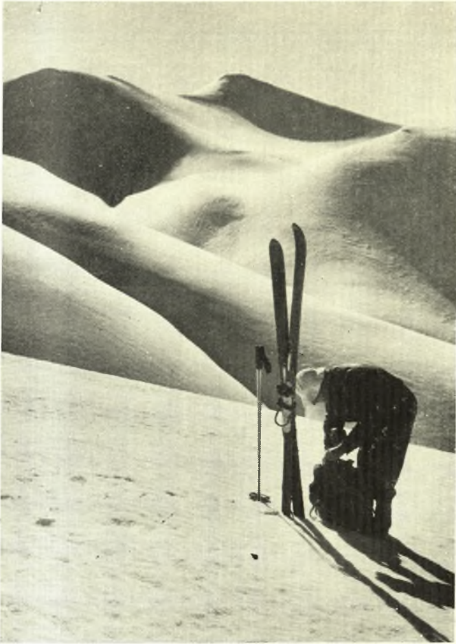
«Ετοιμοί για χιονοδρομίες στις πλαγιές του Όλυμπου»