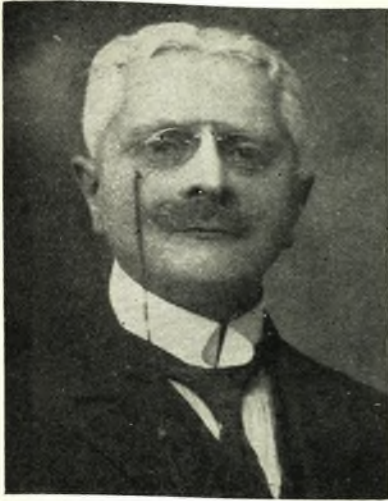
ΓΕΩΡΓΙΟΣ ΚΑΡΑΪΣΚΑΚΗΣ Βουλευτής Καρδίτσας