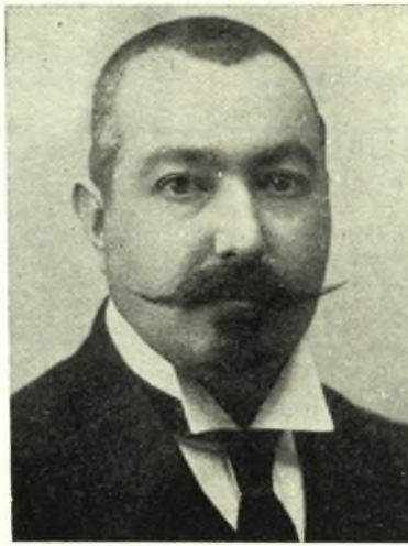
ΚΩΝΣΤ. ΚΑΝΤΑΡΤΖΗΣ Βουλευτής Βόλου