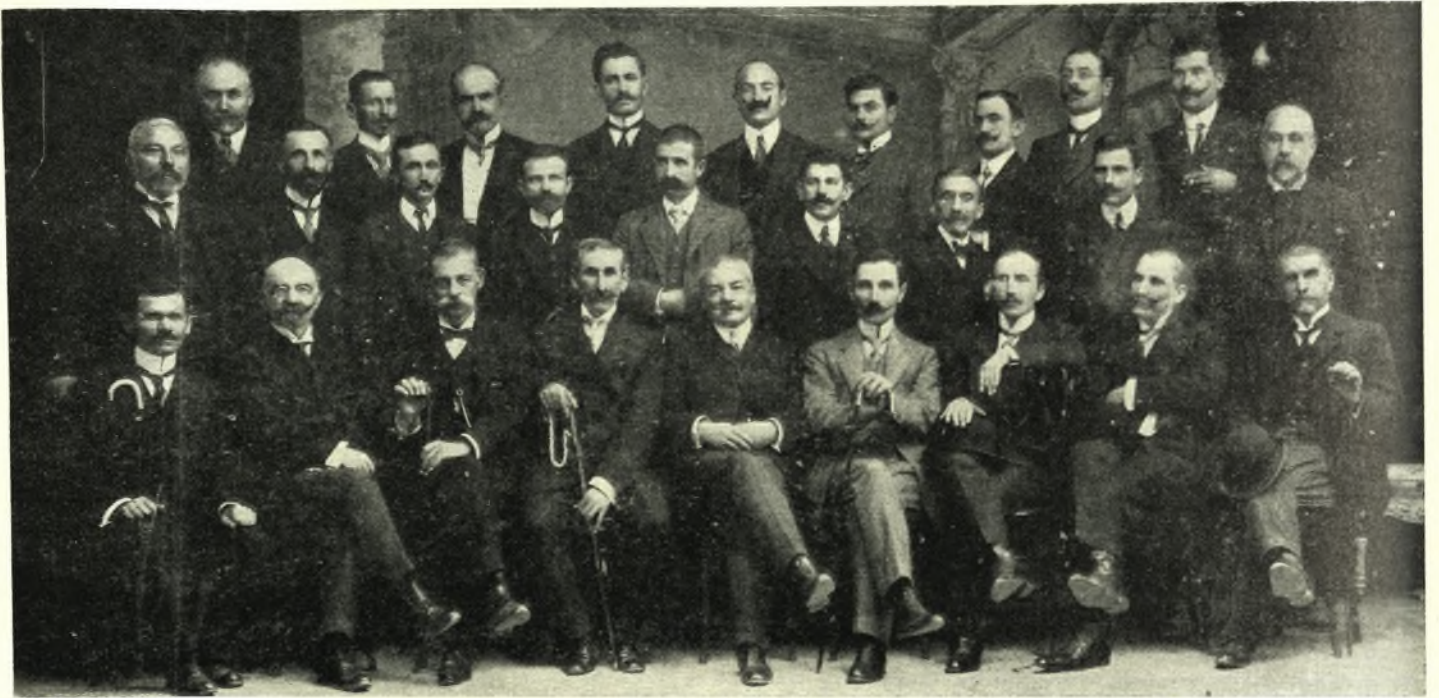
Παλαιοί Θεσσαλοί Βουλευτάι