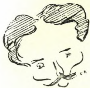
ΑΠΟΣΤΟΛΟΣ ΑΛΕΞΑΝΔΡΗΣ Ύπουργός Παιδείας (Σκίτσο 1911)