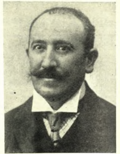
ΓΕΩΡΓΙΟΣ ΛΑΝΑΡΑΣ Βουλευτής Βόλου