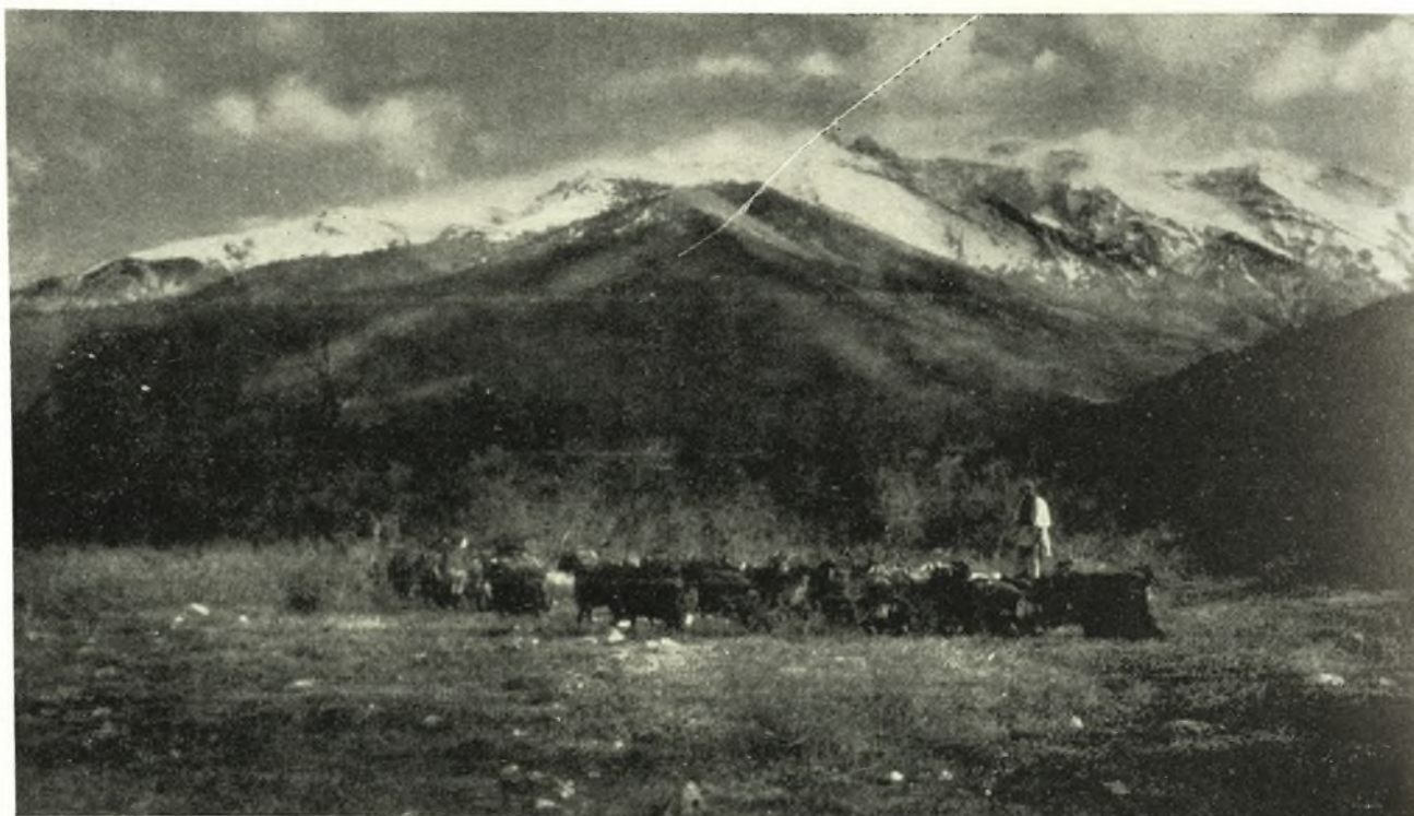
Ποιμενικὴ σκηνὴ στοὺς πρόποδες τοῦ Ὀλύμπου

Ὁ Ὀλυμπος συμβολίζει τὴν ἀκατάλυτη στοὺς αἰῶνες ἀντοχὴ τῆς πολυπαθῆς Ἑλλάδος. Εἶναι ἡ ἐθνικὴ καὶ θρησκευτικὴ κοιτίδα τοῦ Ἑλληνισμοῦ.