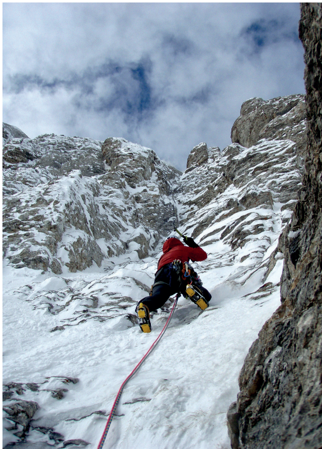
Χειμερινή αναρρίχηση στο Θρόνο του Δία.

Δεξιά: Βγαίνοντας από το Λαιμό και πλησιάζοντας προς το Οροπέδιο των Μουσών