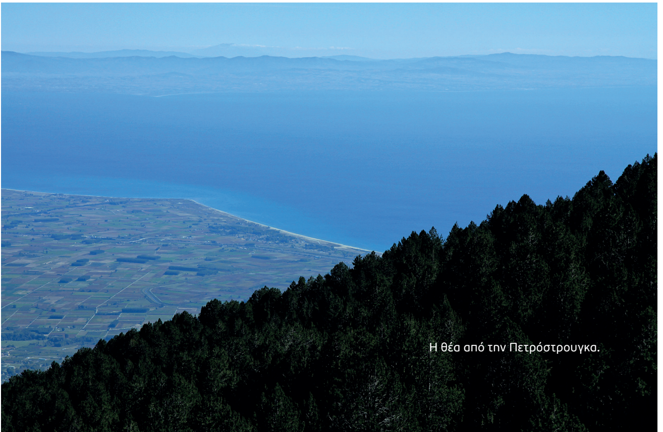
Η θέα από την Πετρόστρουγκα.

-Τώρα πια, με το Καταφύγιο της Πετρόστρουγκας σε λειτουργία, ελάχιστα διαφέρει.