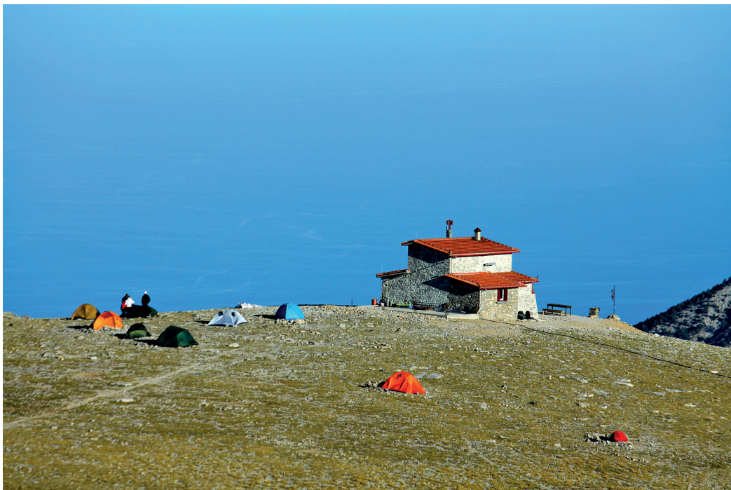
Το καταφύγιο του Κάκκαλου και μερικά από τα αντίσκηνα στην άκρη του Οροπεδίου.

έξω από το κτίριο, στην περίπου επίπεδη ράχη του Οροπεδίου των Μουσών. Πάνω στο χορταριασμένο έδαφος, είναι στημένες πολύχρωμες σκηνούλες. Γερά στερεωμένες όλες, τολμούν με περίσσια αμεριμνησία να ορθώνουν το μικροσκοπικό καμπυλόγραμμο μπόι τους κόντρα στους μανιασμένους βοριάδες του βουνού. Όσο ο ήλιος βρίσκεται στα ψηλώματα τ' ουρανού, αντέχεται η θερμοκρασία στα υπαίθρια τραπεζάκια. Στα τέλη του Σεπτεμβρη, δεν θέλουμε να στερηθούμε το προνόμιο να πίνουμε τον καφέ μας έξω, στην αμόλυνη ατμόσφαιρα του Οροπεδίου των Μουσών, αγναντεύοντας πέλαγα και στεριές απ' το ψηλότερο, το κορυφαίο μπαλκόνι της Ελλάδας. Λίγη ώρα αργότερα, καθώς κρύβεται ο ήλιος και μακραίνουν οι σκιές, η μεταβολή της θερμοκρασίας είναι άμεση και καταλυτική για τις αντοχές μας. Αναζητούμε στο εσωτερικό λίγη ζεστασιά. Το λιλιπούτειο καθιστικό είναι ήδη γεμάτο. Ωστόσο, με φιλότιμες προσπάθειες από όσους μας καλωσορίζουν, στριμωχνόμεστε κι εμείς, «Όλοι οι καλοί χωρούν»!