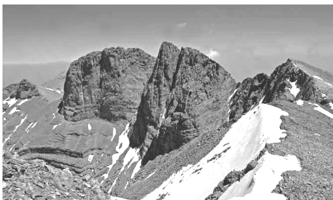
Οι ψηλότερες κορυφές του Ολύμπου από την πλευρά των «Καζανιών» (Δυτικά)